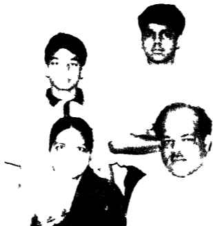
यायाचाये श्री क द्वितीय पुन श्री अ विन् नम ते व ग्नेप नी श्रीमती मनु जेन व लक र्ति